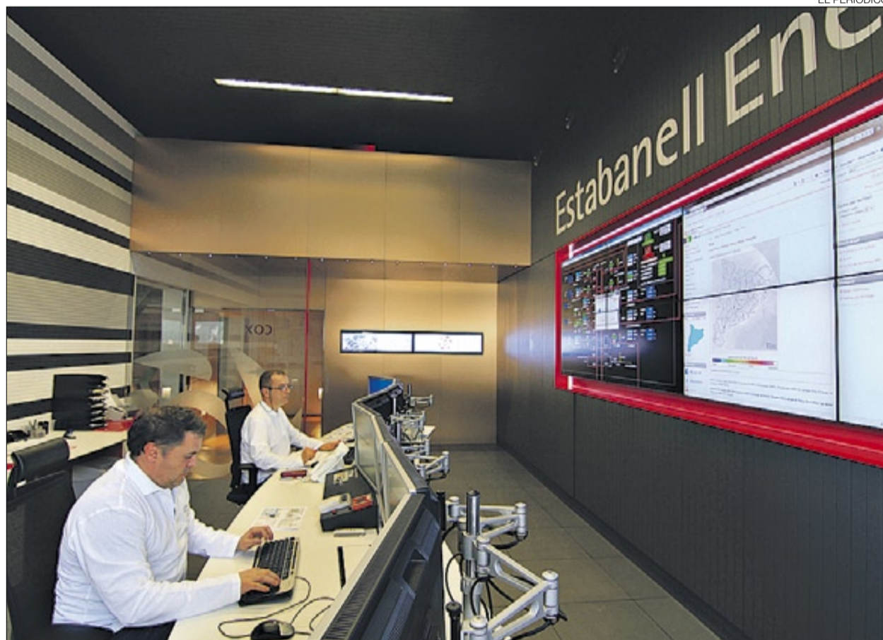
►► Instal·lacions de l'empresa Estabanell Energia, de Granollers.